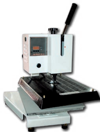
Pressa manuale ad apertura laterale con un piatto cm 35 x 45