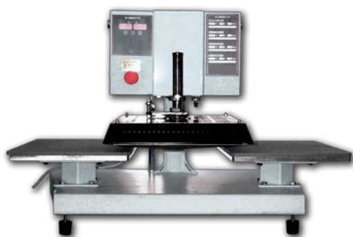
Pressa pneumatica con apertura laterale a due piatti cm 35 x 45