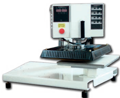
Pressa pneumatica ad un piatto cm 35 x 45 predisposta per due piatti