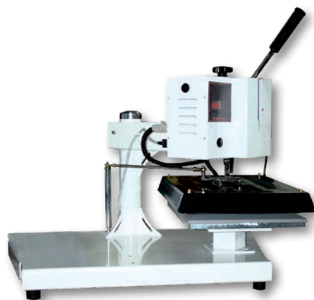
Pressa manuale ad un piatto cm 35 x 45 predisposta per due piatti