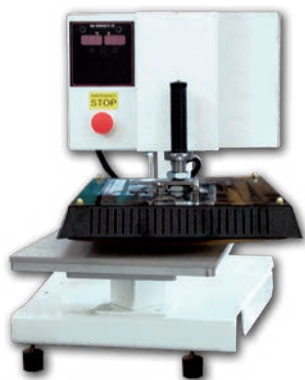
Pressa pneumatica con apertura laterale ad un piatto cm 35 x 45