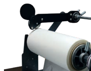
Taglierina per rifilo laterale