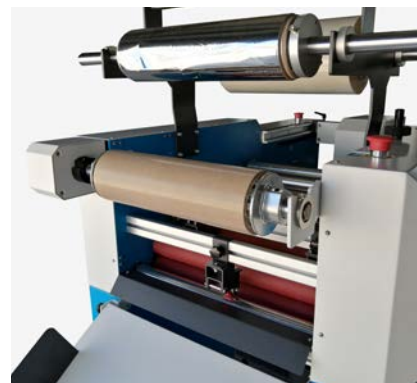
Riavvolgitore per nobilitazione