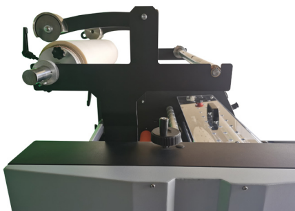
Rifilo bobina e riavvolgitore del foil stampato