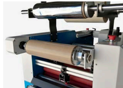
Riavvolgitore per nobilitazione